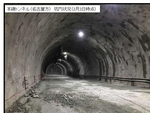
小渋川非常口 施工状況