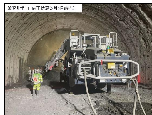
釜沢非常口 施工状況