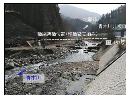
下樽渡橋架替 施工状況

・(国)152号下樽渡橋の架替工事について、現在、現橋の撤去が完了し下部工工事を実施しています。令和5年度は、下部工及び上部工工事を実施する予定です。