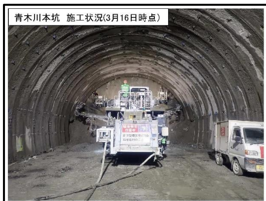
青木川本坑 施工状況