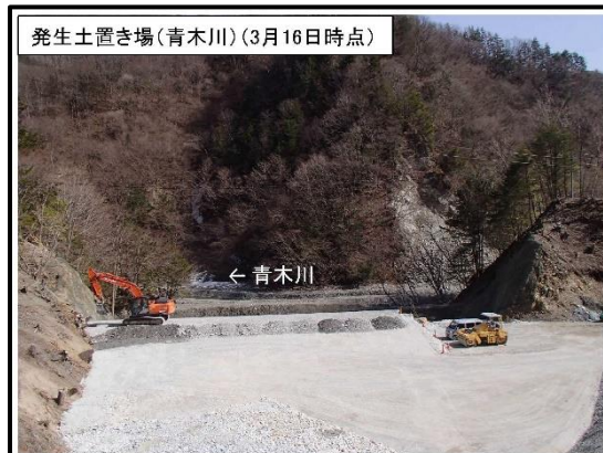
発生土置き場（青木川）