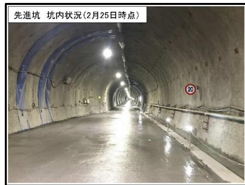
小渋川先進坑 坑内状況