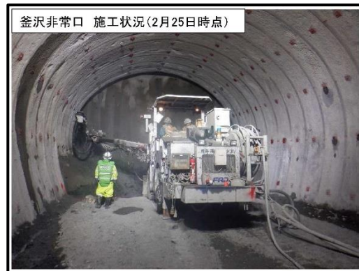
釜沢非常口 施工状況