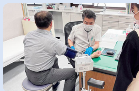
大鹿村立診療所での診療