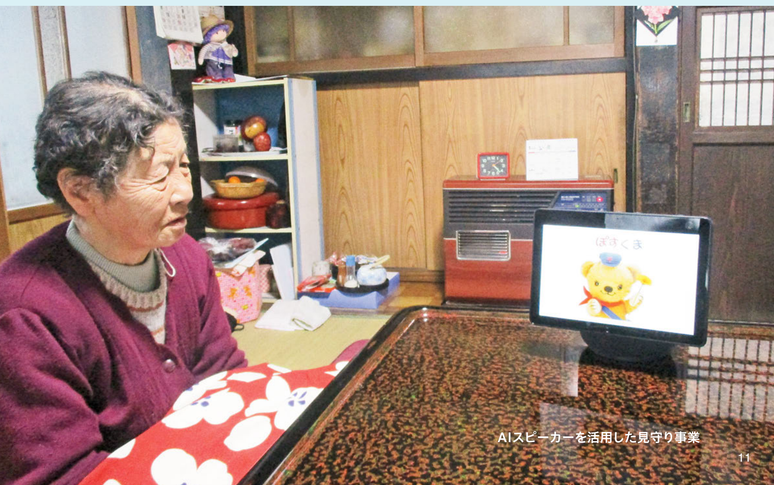
AIスピーカーを活用した見守り事業