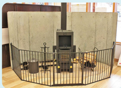
環境にやさしい薪ストーブ 村内の無料Wi-Fiスポットを示す標識