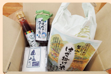
地元農産物を使用した特産品