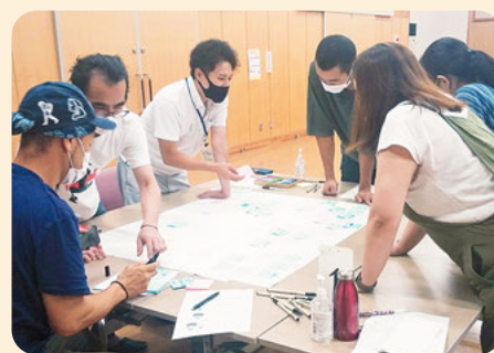
村づくり検討委員会での意見交換